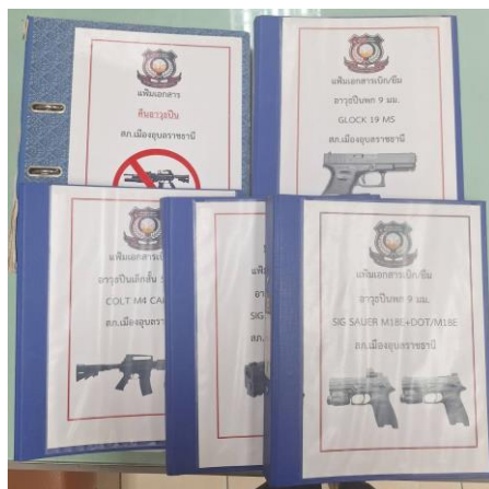
ทะเบียนคุมอาวุธ