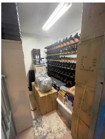
ห้องจัดเก็บอาวุธ